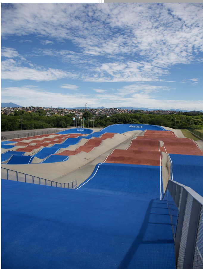
PARQUE RADICAL DE DEODORO – PISTA BMX (LEGADO OLÍMPICO)